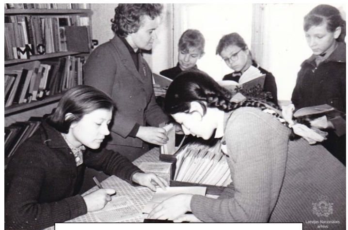
Siguldas astoņgadīgās skolas jaunākie skolnieki skolas bibliotēkā. Sigulda, 1968.gada decembris. Autors: V. Prikulis. LNA LVKFDA 1. f., 41905N.

Daudzi skolotāji vadīja skolēnu ražošanas brigādes Zinātniski pētnieciskajā saimniecībā „Sigulda”, strādāja ražas novākšanas darbos,